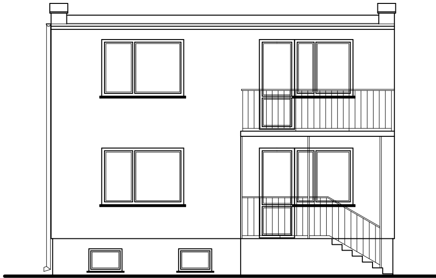
ELEWACJA ZACHODNIA SKALA 1:100